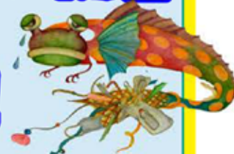
スソナガヒキズリオシヤレウオ

『もしも、こんな魚がいたら!』僕が私が考えた架空の魚を裏面に描いて持ってきてね。藤の広場のサバソニ本部ブースでのガラガラくじに参加できます。もちろん豪華商品あり!! みんなが考えてくれた絵は伊豆高原駅にあるジオテラス伊東で展示しますよ(展示期間6/10から7/10まで)