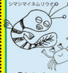
ハートヒトミガニ